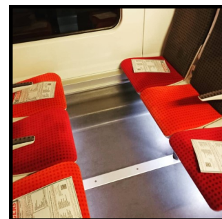
Le 25 janvier 24.000 tracts ont été distribués aux usagers