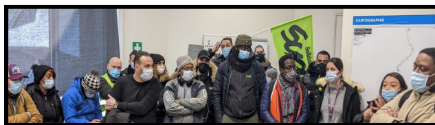
Interpellation de la direction lors de la grève du 27 janvier